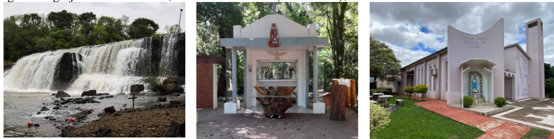
Figura 4: Igreja Matriz São José, Árvore de Páscoa (Osterbaum), Natal Vida.