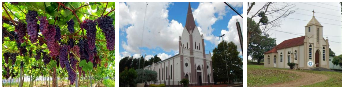
Figura 12: Casa de Vinhos Don Diego, Igreja Matriz São José, Igreja Santo Antônio.