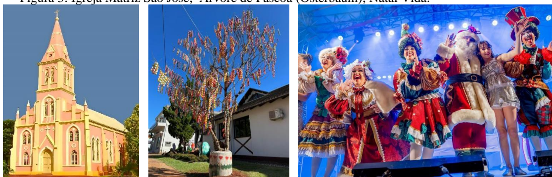
Figura 3: Igreja Matriz São José, Árvore de Páscoa (Osterbaum), Natal Vida.