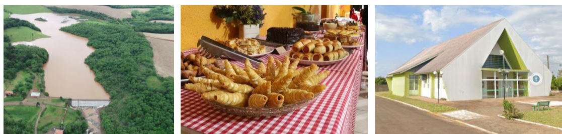
Figura 6: Represa da Hidrelétrica Hidropan, Paróquia Santa Terezinha do Menino Jesus.

De modo geral, Condor apresenta um conjunto diversificado de bens culturais naturais, gastronômicos e religiosos, os quais configuram oportunidades significativas para a estruturação de roteiros integrados de ecoturismo, turismo rural e turismo cultural. A implementação de estratégias de preservação, como manejo ambiental, manutenção arquitetônica, registro de memória oral e fortalecimento das práticas comunitárias, aliada à qualificação da infraestrutura turística e à articulação intermunicipal, constitui caminho fundamental para promover o desenvolvimento sustentável da Rota das Águas, Culturas e Sabores e valorizar a identidade local.