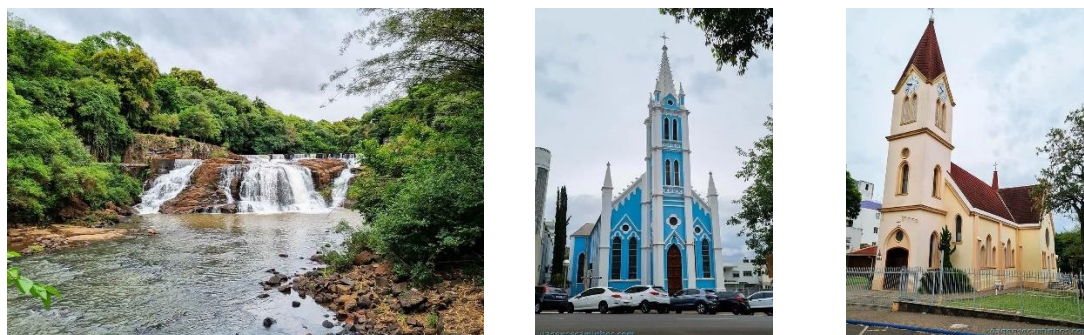
Figura 8: Usina Velha, Paróquia Nossa Senhora da Natividade, Igreja do Relógio.

Em síntese, Ijuí reúne um conjunto expressivo de bens culturais, naturais e históricos com forte potencial para o desenvolvimento turístico integrado, especialmente se forem adotadas estratégias como a criação de rotas temáticas, eventos regulares, sinalização turística moderna e ações de preservação contínua. O município possui condições de consolidar-se como referência em turismo cultural, religioso, histórico e rural no Corede Noroeste Colonial, valorizando tanto sua diversidade étnica quanto seu patrimônio material e imaterial. Por fim, o município de Ijuí destaca-se pela diversidade cultural, reconhecida nacional e internacionalmente como a “Capital Nacional das Etnias”, em 2021, e “Capital Mundial das Etnias”, em 2022.