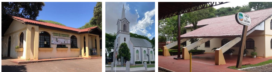
Figura 7: Feira do Produtor, Igreja Evangélica Bom Pastor, Museu Histórico de Coronel Barros.