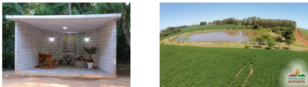
Figura 9: Gruta Nossa Senhora de Lourdes, Lagoa da Mortandade.