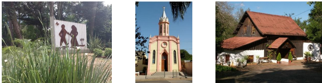
Figura 11: Monumento em Homenagem aos Imigrantes, Igreja Centenária São João Batista, Moinho Velho.