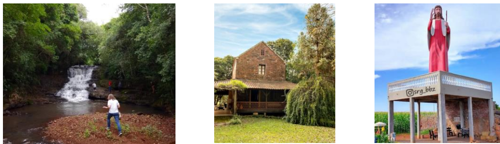
Figura 5: Cascata Rio Colônia das Almas, Moinho Arroio Leão, Cristo Peregrino.