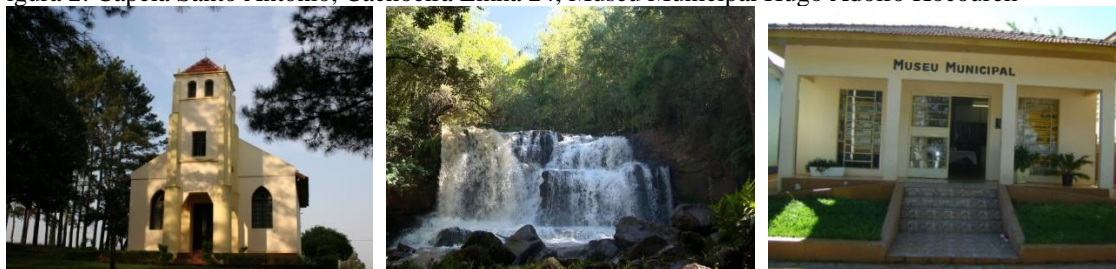
Figura 2: Capela Santo Antônio, Cachoeira Linha 24, Museu Municipal Hugo Adolfo Kocourek